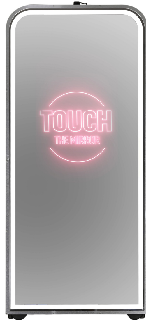
Modell Leeds 43"