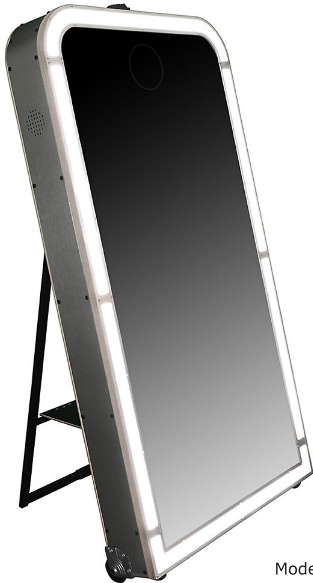
Modell Leeds 50''